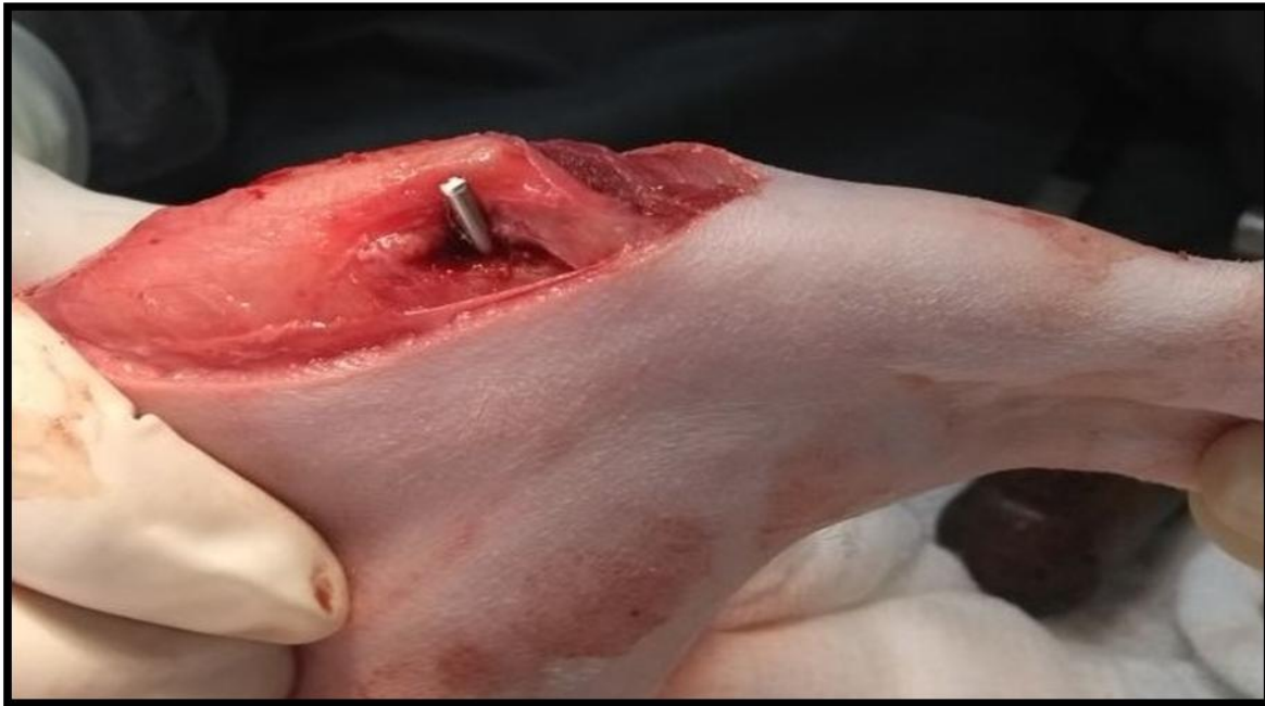
Figura 4 - Fixação final da TT obtida pela inserção de um pino entre a tuberosidade e o córtex medial da tíbia osteotomizada.

Stanke et al. (2014) avaliaram retrospectivamente os fatores de risco para o desenvolvimento de complicações totais e maiores após TTT em 113 cães com luxação medial de patela. Das variáveis relacionadas ao paciente, a idade maior no momento da cirurgia foi correlacionada com risco menor de desenvolvimento de complicações totais (com um decréscimo de 20% na probabilidade de ter qualquer complicação a cada ano adicional). Raças de grande porte tiveram 5,5 vezes mais chance de desenvolver complicações maiores do que cães de pequeno porte. Em relação à variável peso, a cada incremento de 5 kg, a probabilidade de complicações maiores aumentou em 1,3 vezes, o que pode ser explicado pelas forças maiores aplicadas sobre os implantes, com risco maior de falha ou quebra antes da consolidação completa da região osteotomizada, necessitando de reintervenção cirúrgica. A correlação entre peso corporal e o desenvolvimento de complicações também foi demonstrada por Gibbons et al (2006), com percentual de complicações totais na ordem de 29%. Dos métodos de fixação avaliados (um, dois ou três pinos lisos sem banda de tensão, um ou dois pinos rosqueados sem banda de tensão, um parafuso compressivo associado a um ou dois pinos e um ou dois pinos associados à banda de tensão), apenas a fixação com parafuso compressivo foi correlacionada com risco maior de complicações pós-operatórias.