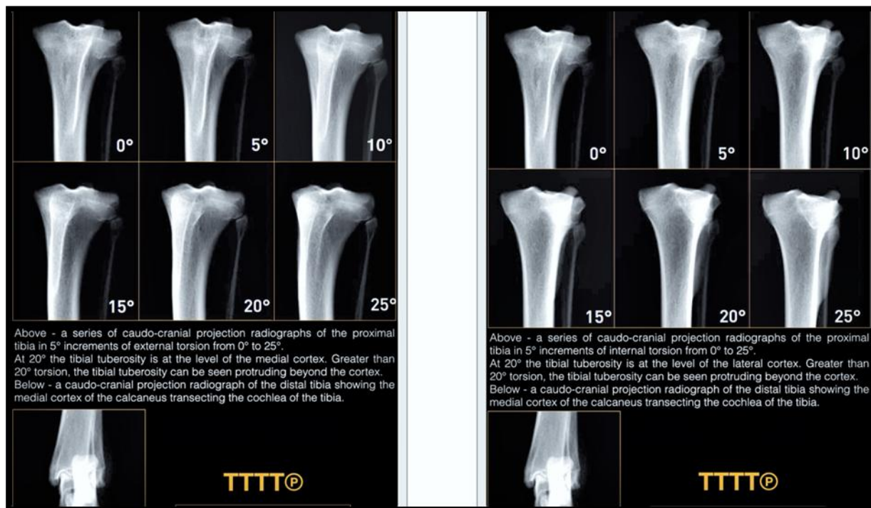
Figura 1 - Posição da tuberosidade tibial no plano frontal e os respectivos ângulos de torção externa (à esquerda) e interna (à direita).

A literatura relata taxas de sucesso elevadas com a utilização da TTT em casos mais graves – acima do grau II de luxação (torção tibial superior a 20°). É possível que a patela seja reduzida com o deslocamento da tuberosidade tibial em casos em que a torção da tíbia proximal é superior a 20°, pois as estruturas de suporte do joelho (ligamentos colaterais, cruzados e meniscos) permitem que a tíbia gire para se adaptar ao redirecionamento do trajeto patelar. O diagnóstico radiográfico (ou por tomografia computadorizada) torna-se necessário para determinar qual é a deformidade anômica (ou as deformidades) subjacente(s) que causa(m) a luxação da patela. Exame radiográfico nas projeções mediolateral e craniocaudal devem ser obtidas do fêmur e da tíbia, individualmente. Para evitar interferências na determinação do ângulo de torção externa ou interna da TT, relacionadas ao posicionamento radiográfico, convencionou-se que o córtex medial do osso calcâneo deve sobrepor o centro da cóclea tibial, conforme descrito por Petazzoni (2015). Para tanto, a extremidade distal da tíbia deve ser elevada, formando ângulo de 90° com o feixe de radiação. A magnificação resultante deve ser levada em conta na mensuração do ângulo de torção. A posição da tuberosidade tibial no plano frontal e os respectivos ângulos de torção estão demonstrados na Figura 1.