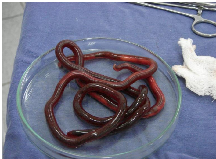
Figura 1 - Imagem fotográfica de dois exemplares de D. renale retirados do rim direito de cão por meio de nefrotomia.

havia melhora em seu estado clínico, assim como normalização do exame neurológico. No décimo quinto dia de pós-operatório, realizou-se a retirada dos pontos e a paciente recebeu alta.